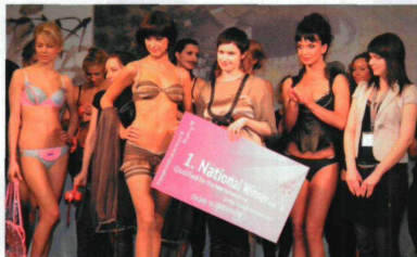
fol. SERWIS PRACOWY MTP