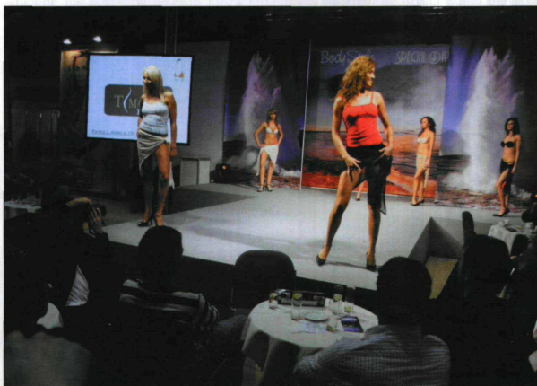
Tegoroczna edycja Targów cieszyła się rekordowym zainteresowaniem

Jednym z ciekawszych wydarzeń na tegorocznej edycji targów w ramach Salonu Body Style, był krajowy finał konkursu „Triumph Inspiration Award” na najbardziej magiczny projekt bielizny. W szranki stanęli studenci najbardziej prestiżowych szkół artystycznych z ponad 30 krajów świata. W polskiej edycji konkursu udział wzięło 12 projektantów z czterech szkół wyższych z Poznania, Katowic, Łodzi