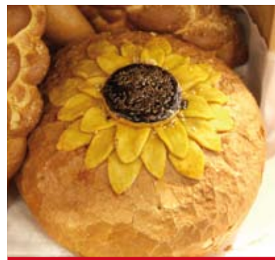
fol. Serwis prasowy MTP

Finał I Mistrzostw Polski Piekarzy: 15 września, pawilon 5, przestrzeń specjalna – stoisko 104, godz. 9.00–17.00