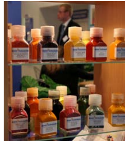
fol. Serwis prasowy MTP

P przed nami kolejne edycje odbywających się pod honorowym patronatem Ministra Rolnictwa i Rozwoju Wsi: Międzynarodowych Targów Technologii Spożywczych Polagra-Tech oraz Międzynarodowego Salonu Dodatków do Żywności. Za nami wiele miesięcy przygotowań, długich godzin owocnych spotkań i konsultacji. Mamy świadomość, że zorganizowanie wyjątkowego spotkania branży wiąże się z możliwością obserwacji tworzących się trendów oraz z prawie nieograniczonym dostępem do wiedzy na temat nowości rynkowych. Daje nam to wiele radości i satysfakcji. Z drugiej jednak strony wymaga wyteźzonej pracy oraz ciągłej obserwacji szybko zmieniającej się sytuacji gospodarczej. W tej analizie od zawsze wspierają nas wystawcy, zwiedzający, liderzy rynku oraz izby i stowarzyszenia branżowe. W tym roku przy przygotowaniu programu targów współpracowaliśmy m.in. z Polską Izbą Dodatków do Żywności, Stowarzyszeniem Rzemieślników Piekarstwa RP, Stowarzyszeniem Cukierników Karmelarzy i Lodziarzy RP, Krajowym Związkiem Spółdzielni Mleczarskich oraz Stowarzyszeniem Naukowo-Technicznym Inżynierów