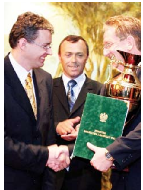
fol. Serwis prasowy MTP, Polagra-Tech 2007

Konkurs o Puchar Ministra Rolnictwa Dodatek Przyjazny Konsumentowi Międzynarodowy Salon Dodatków do Żywności