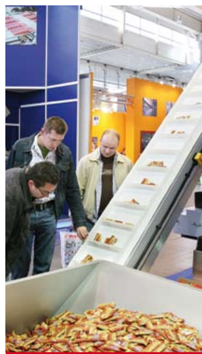
fol. Serwis prasowy MTP