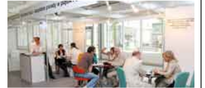
Fot. Serwis prasowy MTP, MEBLE 2008

finansowania zakupu i wybrania najkorzystniejszej oferty kredytowej. Zainteresowanie budziły liczne pokazy popularnych prac wykończeniowych oraz wykłady o trendach i nowościach w branży wnętrzarskiej. Sobotnią atrakcją dla gości targowych była realizacja programu telewizyjnego SOFA, podczas którego znani redaktorzy telewizji WTK zaprezentowali dwie propozycje pokoju dziennego, wymieniając uwagę zarówno z projektantami, jak i z publicznością.