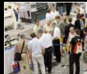
Specjalne pokazy pracy maszyn i urządzeń wzbudzają bardzo duże zainteresowanie. Dają gościom targowym możliwość obserwacji pracy maszyny, a wystawcom okazję do ukazania jej najważniejszych zalet.