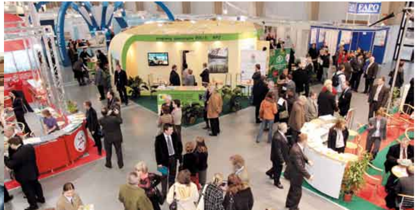
POLEKO 2007