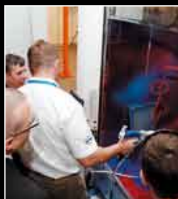
Atrakcją Salonu SUR-FEX jest interaktywna ekspozycja Poligon Umiejętności. Na specjalnej przestrzeni demonstracyjnej odbywają się prezentacje nowych technologii i urządzeń. Każdy zwiedzający może zapoznać się z całym procesem technologicznym, a nawet wypróbować najnowsze urządzenia.