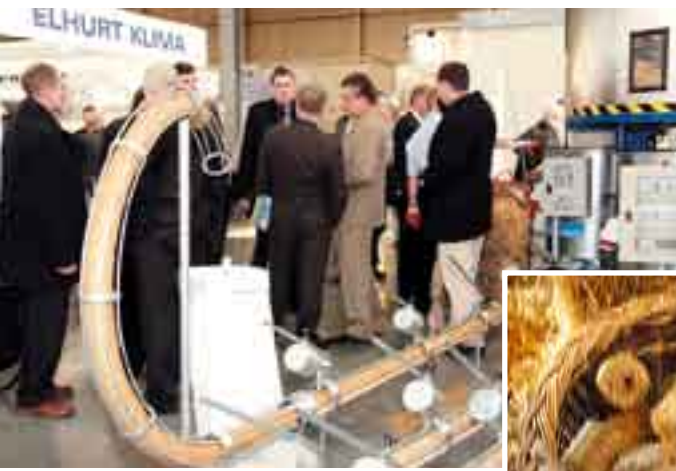
Fot. Serwis prasowy MTP; POLEKO 2007

Targi POLEKO mają nie tylko wymiar handlowy i biznesowy, ale pełnią również wybitną rolę edukacyjną. To tu odbywa się finał wielu konkursów, organizowane są specjalne występy, przeprowadzane różne akcje. Podczas tegorocznych targów POLEKO odbędzie się Młodzieżowy Szczyt Klimatyczny.