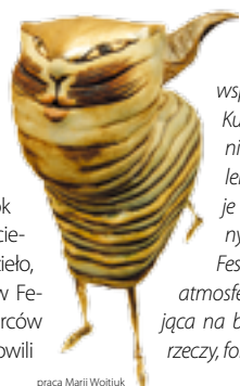
praca Marii Wojtki

Na Festiwalu będzie można dokonać zakupów. Artyści sami sprzedają i wyceniają swoje prace. Zainteresowanie publiczności Festiwalem z roku na rok rośnie, coraz więcej osób bowiem ucieka od masowej produkcji, ceni rękodzieło, chce być bliżej sztuki. W 2007 roku w Festiwalu wzięło udział ponad 450 twórców z całej Polski – 1/3 spośród nich stanowili