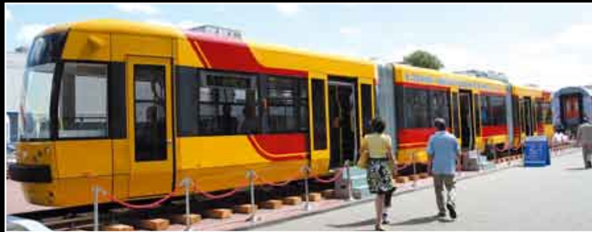
Wśród pokazanych na targach środków transportu zbiorowego królowały pojazdy szynowe. Zdaniem specjalistów właśnie transport szynowy czeka w najbliższych latach potężna modernizacja, a więc zakupy o wartości kilku miliardów złotych.