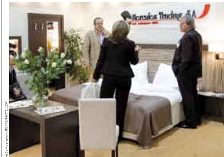
Fot. Serwis prasowy MTP, INVEST-HOTEL 2007