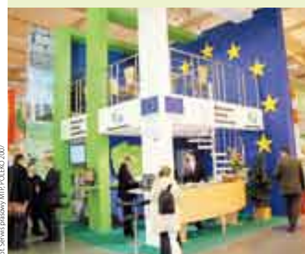
Fot. Serwis prasowy MTP; POLEKO 2007