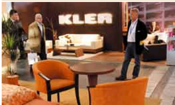
Fot. Serwis prasowy MTP INVEST-HOTEL 2007

W 2007 r. powierzchnia ekspozycji targów INVEST-HOTEL przekroczyła 2500 m 2 , zaprezentowało się tu ponad 100 wystawców, wśród których nie zabrakło wielu liderów rynku.