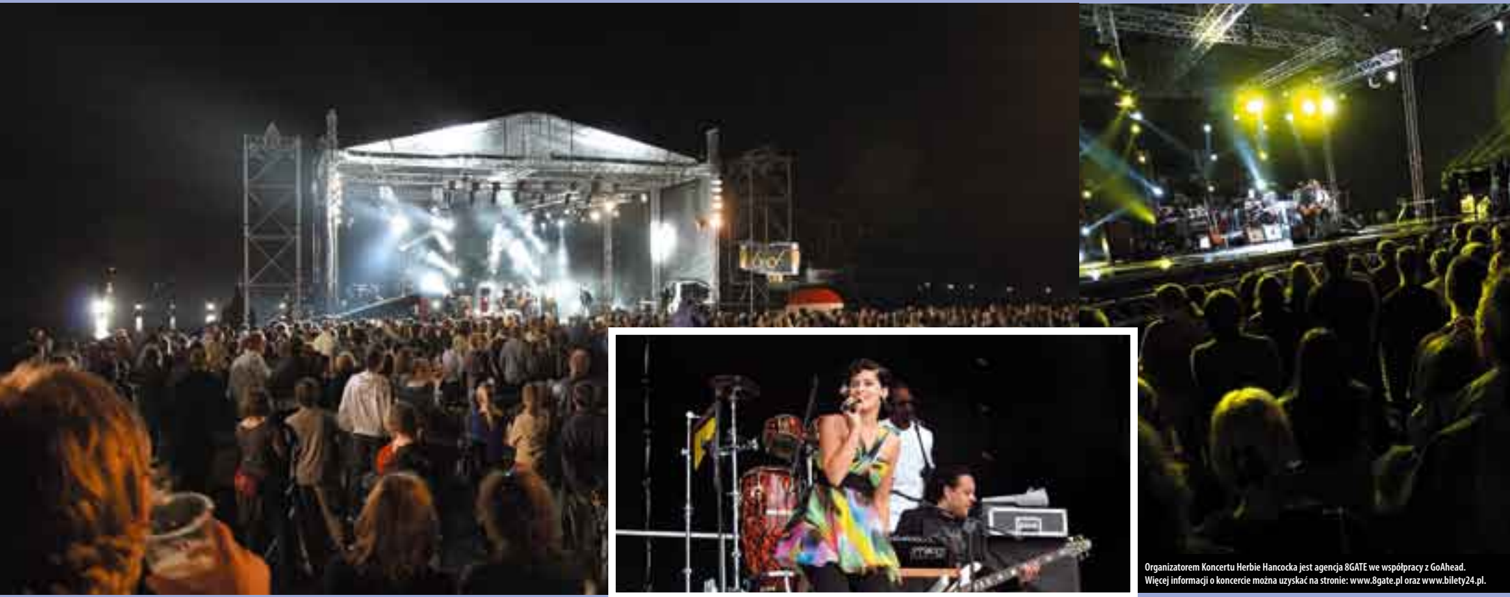
Organizatorem koncertu Herbie Hancocka jest agencja 8GATE we współpracy z GoAhead. Więcej informacji o koncercie można uzyskać na stronie: www.8gate.pl oraz www.bilety24.pl .

2 grudnia 2008 roku w poznańskiej hali widowiskowo-sportowej „Arena” wystąpi jeden z najlepszych pianistów i kompozytorów jazzowych na świecie – Herbie Hancock. Już jako muzyczne „cudowne dziecko” w wieku siedmiu lat grał na fortepianie, jako jedenastoletek zagrał swój pierwszy koncert fortepianowy Mozarta z Orkiestrą Symfoniczną z Chicago, a mając dwadzieścia jeden lat nagrał pierwszą płytę. Od tego momentu muzyczna kariera artysty nabrała rozpędu, rozpoczął również współpracę z wieloma znaczącymi muzykami jazzu. Jego twórczość to swoista mozaika wynikająca z łączenia jazzu z innymi gatunkami muzyki, w których porusza się z równą swobodą. Jest jednym z wielkich pianistów późnego modern jazzu, którzy wywarli największy wpływ na grę na tym instrumencie. Podziw publiczności budzi zwłaszcza jego inwencja rytmiczna i improwizacyjna. Wiele kompozycji artysty stało się standardami. Muzyk jest zdobywcą dwóch tegorocznych nagród Grammy w kategoriach Album roku i Najlepszy album jazzowy oraz nagrody Musician of the Year przyznawanej przez Jazz Journalists Awards. Warto również przypomnieć, że w 1986 roku otrzymał Oscara za muzykę do filmu „Round Midnight”. Artysta wystąpi w Poznaniu w ramach trasy koncertowej Herbie Hancock Quintet. Na koncercie nie zabraknie zarówno utworów z płyty „Possibilities” będącej intymnym portretem artysty, jak i utworów z jego najnowszej płyty