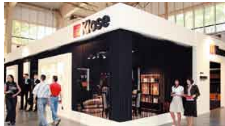
Stoisko firmy Klose nagrodzone nagrodą Acanthus Aureus.

z najważniejszych imprez świata meblarskiego w Polsce, dlatego od początku swojego istnienia na polskim rynku jesteśmy na nich stale obecnym wystawcą. Targi MEBLE to nie tylko okazja do pozyskania nowych partnerów handlowych, to przede wszystkim szansa na zaprezentowanie firmy i jej osiągnięć. Służą prezentacji najbardziej nowatorskich projektów z aktualnej oferty, wymianie informacji, kreowaniu wizerunku firmy, sprzyjają również wzrostowi znajomości produktów, budowaniu marki. A przecież mocna marka to najlepsza inwestycja na przyszłość, zwłaszcza że musimy zmierzyć się z konkurencją na rynkach eksportowych. Kiedy debiutowaliśmy na polskim rynku, nasze uczestnictwo w targach miało w głównej mierze przyczynić się do pozyskania nowych kontaktów handlowych oraz do pokazania solidności i jakości wykonania na-