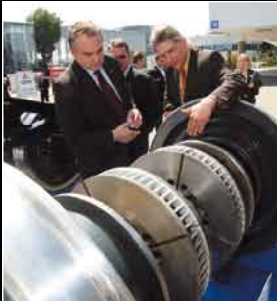
Nic dziwnego, że wiceprezesa Rady Ministrów, ministra gospodarki Waldemara Pawlaka podczas zwiedzania targów ITM Polska interesowały szczegóły techniczne – jest przecież inżynierem.

Z ofertą wystawców ITM Polska 2008 zapoznali się 22 000 zwiedzających z 35 państw i terytoriów. Wprowadzony przez organizatorów system rejestracji pozwala na określenie profilu gości targowych. Okazuje się, że wśród zwiedzających dominują decydenci, prezesi, właściciele firm, menadżerowie, kierownicy i handlowcy.