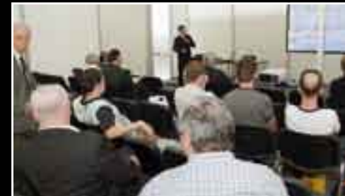
Podczas targów ITM Polska odbywa się kilkadziesiąt konferencji i seminariów. Niektóre z nich, jak np. Innowacje w budowie i eksploatacji maszyn, towarzyszą targom już od kilku lat. Co roku poruszane są na niej najbardziej aktualne tematy.