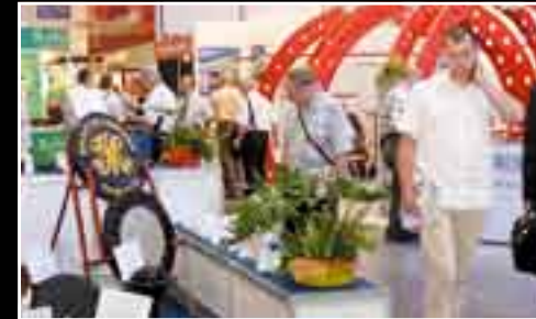
Polscy rynek odlewniczy cechuje wysoki potencjał wytwórczy oraz dobrze rozwinięte zaplecze naukowo-badawcze. Było to wyraźnie wyeksponowane na stoisku Centrum Polskiego Odlewnictwa.