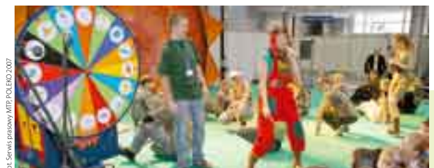
POLEKO 2007

Tradycyjnie podczas targów POLEKO odbywa się Międzynarodowy Zjazd Ekologiczny. Jego uroczyste otwarcie nastąpi już pierwszego dnia targów. Spotkają się na nim przedstawiciele administracji państwowej, władz samorządowych, sektora usług komunalnych, polskich i zagranicznych przedsiębiorstw oraz innych organizacji działających na rzecz ochrony środowiska. Tematem konferencji problemowej zjazdu jest „Przemysł wobec nowych wyzwań ochrony środowiska i klimatu”. Zagadnienia związane ze zmianami klimatycznymi, jakie zachodzą na świecie, poruszane będą również na wielu innych konferencjach. Specjalne seminarium „Przeciwdziałanie zmianom klimatu – działania władz lokalnych” organizuje Związek Miast Polskich. Specjalistyczne tematy omawiane będą na spotkaniach organizowanych w ramach Forum Recyklingu i Forum Czystej Energii. Zorganizowana zostanie Debata Odpadowa oraz Waterworks Forum. Bardzo istotne zagadnienia związane z możliwościami pozyskania pieniędzy unijnych (do 2013 roku na inwestycje związane z ochroną środowiska Polska będzie mogła wydać 12,5 mld euro) będą omawiane na konferencji „Fundusze europejskie na ochronę środowiska”. To wszystko budzi duże zainteresowanie branży. W ubiegłym roku targi zwidliło ponad 23 000 osób z 32 krajów i 4 kontynentów. Akredytowało się 299 dziennikarzy z Polski i zagranicy.