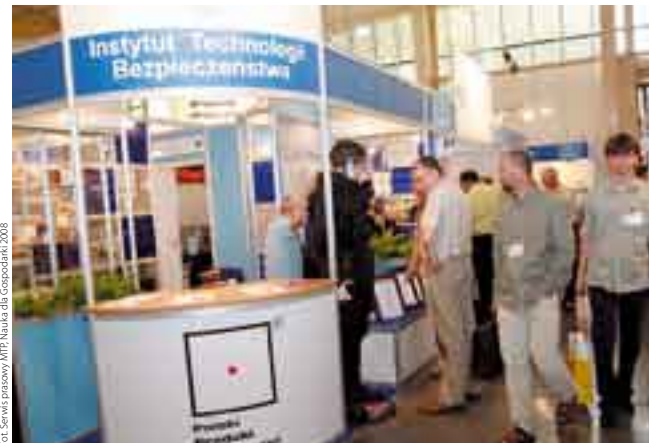
Nauka dla Gospodarki 2008

Salon NAUKA DLA GOSPODARKI to największa w kraju prezentacja dorobku i potencjału badawczego polskiej nauki stosowanej. Odbywa się w czasie targów ITM Polska i jest ich integralną częścią. Taki mariaż nauki i nowoczesnych technologii dla przemysłu jest okazją do nawiązania wzajemnych kontaktów między sektorem nauki a sektorem gospodarki. Część stoisk jednostek naukowo-badawczych, jak również firm i instytucji wspierających procesy transferu technologii wkomponowane jest w ekspozycje przemysłu – stoiska producentów i handlowców. Ta bliskość sprzyja nawiązywaniu dobrych kontaktów. Ofertę wystawców, w tym prezentację nowości, dopełnia zawsze program wydarzeń – fachowych konferencji i spotkań biznesowych. Salonowi NAUKA DLA GOSPODARKI tradycyjnie już towarzyszy Forum Inżynierskie, podczas którego prowadzone są rozmowy i dyskusje na temat najpilniejszych problemów gospodarki i techniki. Zadaniem Forum jest promocja innowacyjności. Tegoroczne Forum odbyło się pod hasłem: „NOT – promotorem innowacyjnych przedsiębiorców”. Wszystkie działania wokół salonu NAUKA DLA GOSPODARKI mają