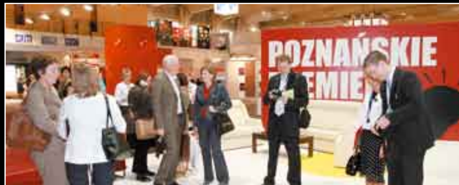
Fot. Serwis prasowy MTP, MEBLE 2008

Już po raz szósty zarówno targowcy, jak i firmy niebierące udziału w targach zaprezentowały rynkowe nowości na wystawie zatytułowanej Poznańskie Premiery . To doskonała okazja do poznania najnowszych trendów w designie i kolorystyce. Tegoroczną edycję tej wystawy wyróżniała gra barw – nasycone kolory ścian i podłogi sprawiały, że nie sposób było przejść obok niej obojętnie. Na przestrzeni ponad 400 m 2 meble prezentowane były w formie pełnych aranżacji wnętrz mieszkalnych.