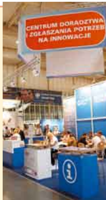
Fot. Serwis prasowy MTP, Nauka dla Gospodarki 2008

Centrum Doradztwa i Zgłaszania Potrzeb na Innowacje – to nowy projekt, którego celem jest wspieranie innowacyjnego rozwoju przedsiębiorstw poprzez ułatwienie kontaktu przedsiębiorców z placówkami naukowo-badawczymi i naukowcami. Przedsiębiorcy – wystawcy i zwiedzający ITM Polska – mieli możliwość zgłaszania swoich problemów i potrzeb na innowacyjne rozwiązania. Za pośrednictwem Centrum wyszukiwane były jednostki badawczo-rozwojowe, państwowe wyższe uczelnie oraz instytuty Polskiej Akademii Nauk, które odpowiadały na te potrzeby, proponując możliwe rozwiązania. Potrzeby te można było zgłaszać on-line oraz podczas trwania targów na specjalnie przygotowanym stoisku. Obsługa Centrum pomagała klientowi zdefiniować potrzebę i informowała o niej uczestniczące w targach jednostki nauki. Łącznie przedsiębiorcy zgłosili kilkadziesiąt tematów. Do spotkań stron często dochodziło jeszcze na targach, a jeśli nie – zgłoszenie zachowywano w bazie danych, a partnera wyszukiwano już po targach. Rejestracja potrzeb, wyszukiwanie partnerów przed, w czasie i po targach oraz udział w spotkaniach były bezpłatne. Dzięki obecności na targach przedstawiciele Ministerstwa Nauki i Szkolnictwa Wyższego, Polskiej Agencji Rozwoju Przedsiębiorczości, Centrum Innowacji NOT, Rady Głównej Jednostek Badawczo-Rozwojowych oraz Urzędu Patentowego można było uzyskać wiele cennych informacji, m.in. dowiedzieć się, jak i skąd można otrzymać dofinansowanie na wdrożenie projektów innowacyjnych.