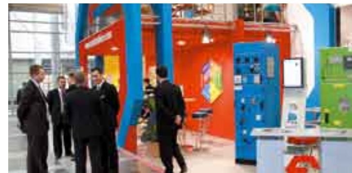
Fot. Serwis prasowy MTP, EXPOPOWER 2008

Trzy targowe dni wypełnione były szczerze przez prezentacje, dyskusje i seminaria. Zdominowały je zagadnienia bezpieczeństwa energetycznego, a w tym kontekście potencjału źródeł odnawialnych, poszanowania energii, efektywności energetycznej. Przedstawiciele ministerstw i instytucji centralnych, branżowych organizacji gospodarczych, wytwórców, sprzedawców i dystrybutorów energii, a także organizacji konsumenckich zgromadziła debata poświęcona projektowi ustawy o efektywności energetycznej. Nie zabrakło konferencji czysto technicznych, a także związanych z zagadnieniami prawnymi funkcjonowania rynku energii. Podczas targów odbył się także finał ogólnopolskiej akcji edukacyjnej „Bezpieczniej z prądem”.