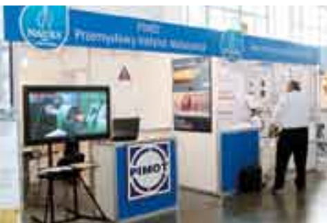
Nauka dla Gospodarki 2008

W tym roku w salonie NAUKA DLA GOSPODARKI uczestniczyło ponad 70 wystawców z Polski i Niemiec. Były to zarówno jednostki naukowo-badawcze, jak również firmy i instytucje wspierające procesy transferu technologii. Ekspozycje polskich jednostek nauki były dofinansowywane przez Ministerstwo Nauki i Szkolnictwa Wyższego.