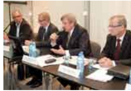
Fot. Serwis prasowy MTP, MEBLE 2008

Przez cztery dni najzdolniejsi studenci szkół artystycznych z całej Polski oraz z renomowanej uczelni Royal College of Art z Londynu pracowali w specjalnie wydzielonym dla nich pawilonie nad projektami meblóścianki. Dzięki warszatom i kreatywnym pomysłom młodych projektantów mebel stał się niewyczerpanym źródłem inspiracji, różnorodnych interpretacji i zaskakujących realizacji. Trzy zwycięskie projekty zostaną wdrożone do produkcji przez firmę Vox.