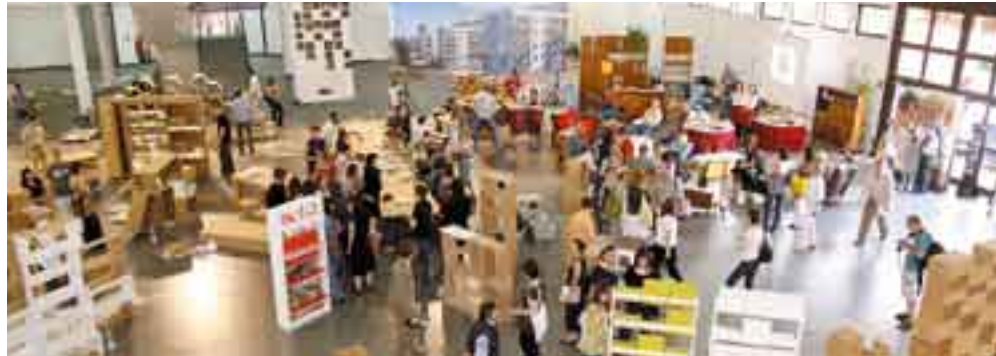
MEBLE 2008