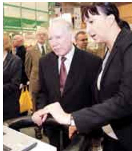
Targi POLEKO odbywają się pod honorowym patronatem Ministra Środowiska. Pan prof. Maciej Nowicki, minister środowiska, z zainteresowaniem ogląda ekspozycję targową.

Jak co roku, pokażą na swoich stoiskach wiele nowości, które oznaczone specjalnymi znakami ułatwiają zwiedzającym odnalezienie ich wśród bogatej oferty. W ramach ekspozycji Nauka dla Środowiska swoją innowacyjną ofertę zaprezentuje około 50 jednostek badawczo-rozwojowych i instytutów naukowo-badawczych oraz innych instytucji działających w sferze szeroko rozumianej ekologii. Tak jak w latach ubiegłych swoje stoiska będą miały m.in. Ministerstwo Środowiska, Departament Koordynacji Programów Infrastrukturalnych w Ministerstwie Rozwoju Regionalnego, Ministerstwo Nauki i Szkolnictwa Wyższego, Instytut Meteorologii i Gospodarki Wodnej, Instytut Ekologii Terenów Uprzemysłowionych, Narodowy Fundusz Ochrony Środowiska i Gospodarki Wodnej, wojewódzkie fundusze ochrony środowiska i gospodarki wodnej oraz Bank Ochrony Środowiska. W tym roku wojewódzkie fundusze ochrony środowiska będą obchodziły jubileusz 15-lecia i przygotują podczas targów między innymi specjalną konferencję. Nie zabraknie w tym roku również wspólnych narodowych ekspozycji firm, organizowanych pod patronatem agencji lub instytucji rządowych. Na przykład w ubiegłym roku oficjalne wystąpienia narodowe pod patronatem agencji bądź instytucji rządowych zorganizowały Czechy, Dania, Francja, Hiszpania, Niemcy, Norwegia, Szwajcaria i Szwecja.