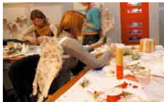
Fot. Serwis prasowy MTP, FPA, 2007

Na Festiwalu w sposób szczególnie eksponowana jest sztuka młodych twórców. W ubiegłym roku prace studentów Akademii Sztuk Pięknych z Poznania i Łodzi były prezentowane na wydzielonych przestrzeniach. Na specjalnej wystawie zatytułowanej „Kobiecość” pokazano osiągnięcia twórcze członków Koła Naukowego „Niezaletni” działającego przy Akademii Sztuk Pięknych w Poznaniu.