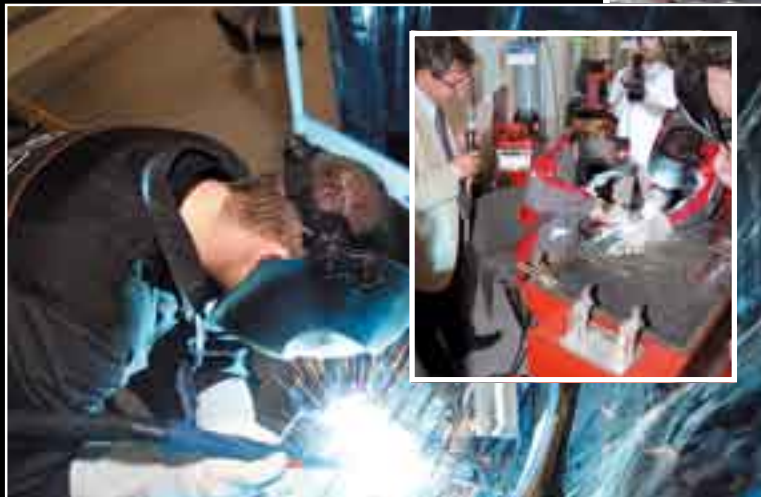
Już po raz czwarty Międzynarodowe Targi Poznańskie we współpracy z Instytutem Spawalnictwa zorganizowały podczas targów ITM Polska 2008 warsztaty Akademia Spawania. Jest to jedno z głównych wydarzeń Salonu WELDING. Podczas warsztatów wygłaszane są prelekcje, odbywają się pokazy najnowszych urządzeń i technologii.