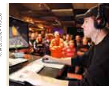
Fot. Serwis prasowy MTP, PGA, 2007

Po raz pierwszy w Polsce właśnie na PGA gościł w ubiegłym roku Johnathan (Fatal1ty), gwiazda światowego gamingu, który przyjechał na zaproszenie firmy Creative. Jest profesjonalnym graczem komputerowym i zarazem najbardziej znanym zawodnikiem na świecie. Ma na swym koncie już ponad pół miliona dolarów wygranych w setkach turniejów komputerowych.