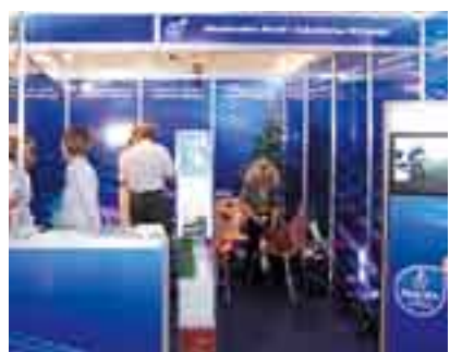
Nauka dla Gospodarki 2008

W tym roku w salonie NAUKA DLA GOSPODARKI uczestniczyło ponad 70 wystawców z Polski i Niemiec. Były to zarówno jednostki naukowo-badawcze, jak również firmy i instytucje wspierające procesy transferu technologii. Ekspozycje polskich jednostek nauki były dofinansowywane przez Ministerstwo Nauki i Szkolnictwa Wyższego.