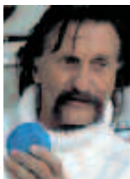
Luigi Colani.

W tym roku czeka Państwa niewątpliwie ogromna niespodzianka. Organizatorzy są w trakcie rozmów